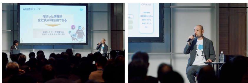
「UdataNOW25」セッションの様子

セッションでは、運用を担う当社情報システム担当者が、当社の現状や課題を踏まえ、ワークショップの開催などにより現場の意見を吸い上げながら「Agentforce」を運用している事例について説明させていただき、盛況のうちに終了となりました。