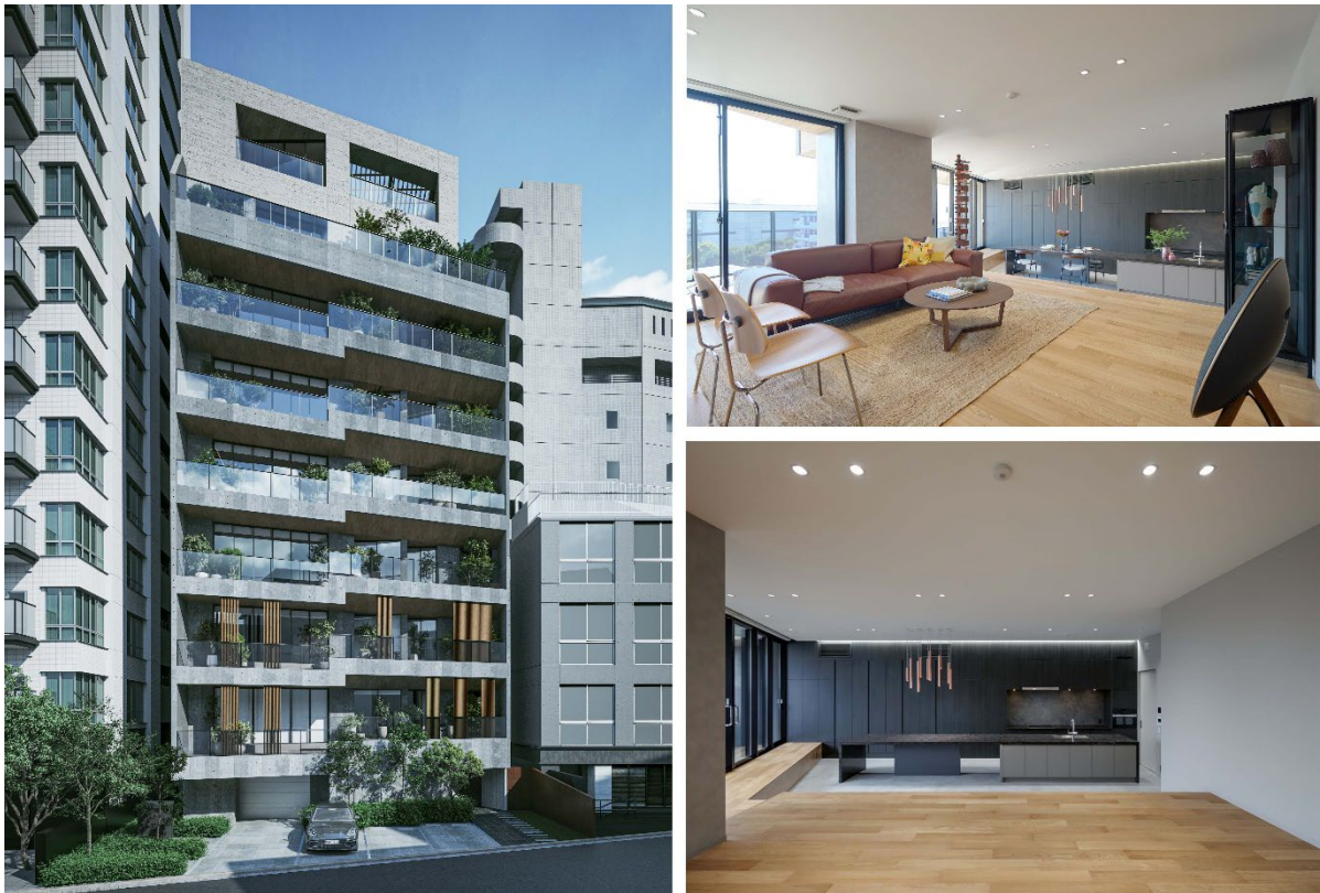
【『THE GRANDUO MINAMIAOYAMA』 外観・内観】